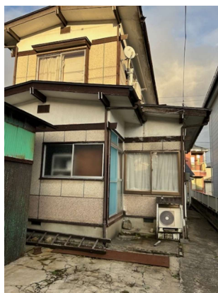
※表示画像が現況と相違がある場合は、現況を優先いたします